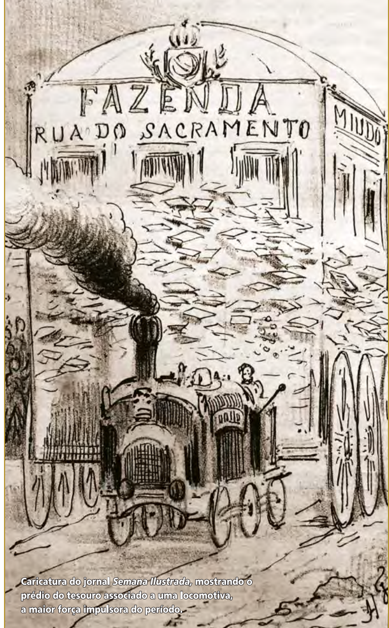
Caricatura do jornal Semana Ilustrada , mostrando o prédio do tesouro associado a uma locomotiva, a maior força impulsora do período.

Um perigo sério, que afetava um importante prédio público da capital do Império e o dinheiro que ali