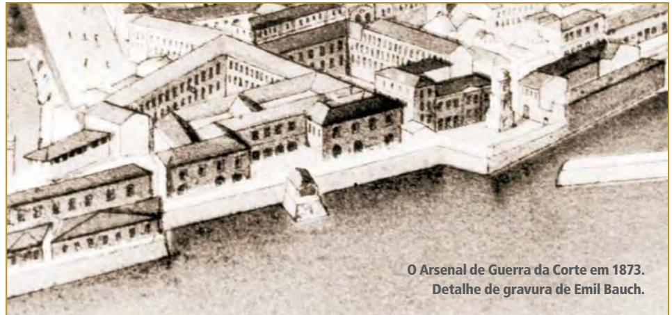
O Arsenal de Guerra da Corte em 1873. Detalhe de gravura de Emil Bauch.

Infelizmente, os trabalhos do Exército nessa área caíram na “vala comum do esquecimento”. E aqui che-