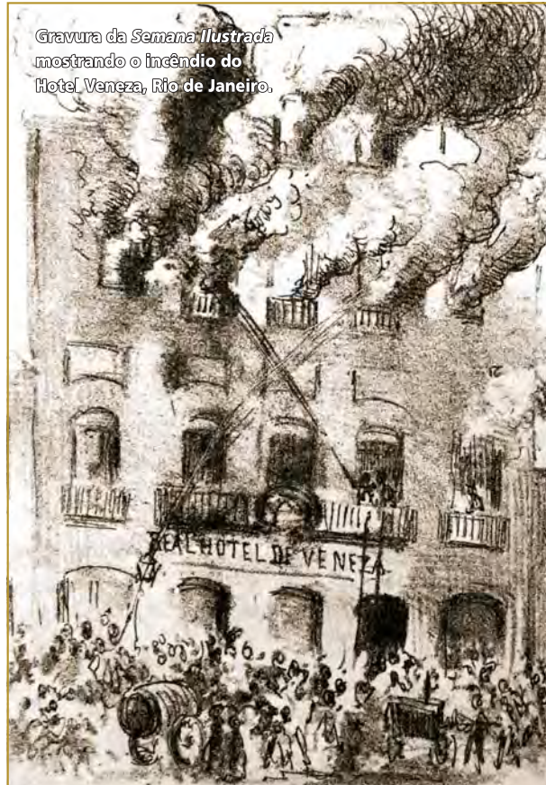
Gravura da Semana Ilustrada mostrando o incêndio do Hotel Veneza, Rio de Janeiro.