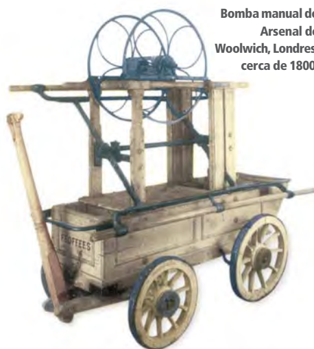
Bomba manual do Arsenal de Woolwich, Londres, cerca de 1800.

minuía em muito a confusão natural em um incêndio. Desta forma, em todos os grandes desastres que ocorreram até meados do século XIX – e em muitos do século XX – a presença de soldados do Exército foi uma constante. De fato, o toque dos sinos das igrejas, a rebate, era um sinal convençãoado para invasão ou incêndio, casos em que os militares deviam estar prontos a atuar.