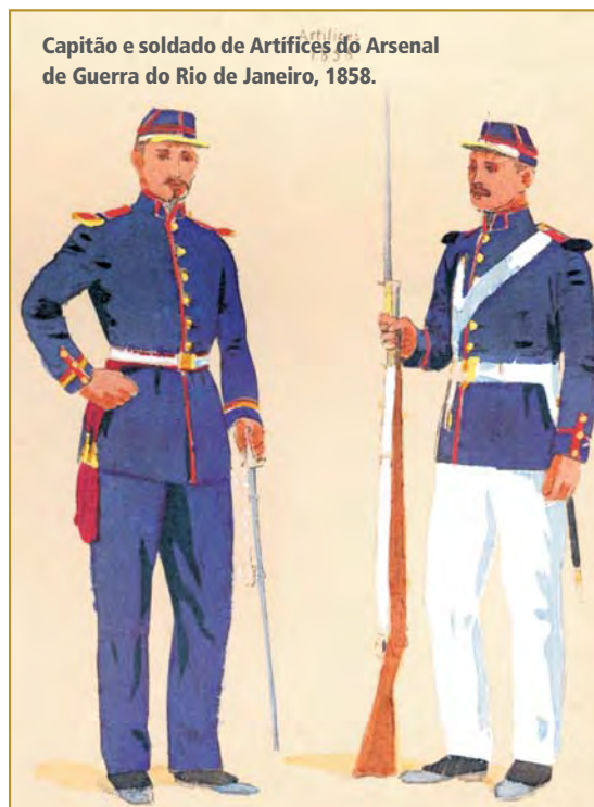
Capitão e soldado de Artífices do Arsenal de Guerra do Rio de Janeiro, 1858.