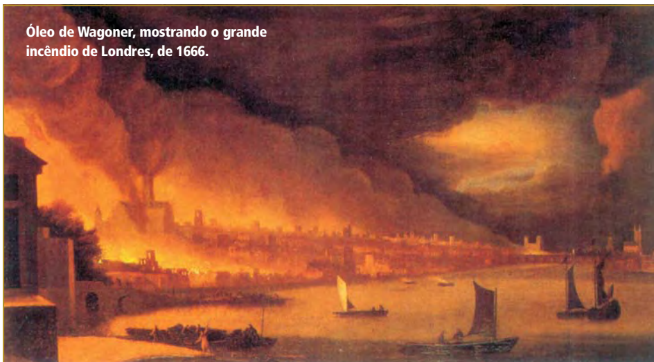
Óleo de Wagoner, mostrando o grande incêndio de Londres, de 1666.

soldados aquartelados permanentemente estavam sempre prontos para acudir a qualquer emergência, a qualquer hora do dia. Apesar de normalmente não terem treinamento específico ou habilidades como os marinheiros, eram disciplinados, acostumados a obedecer ao pensamento de um cérebro que guiava suas ações – os seus oficiais –, o que certamente di-