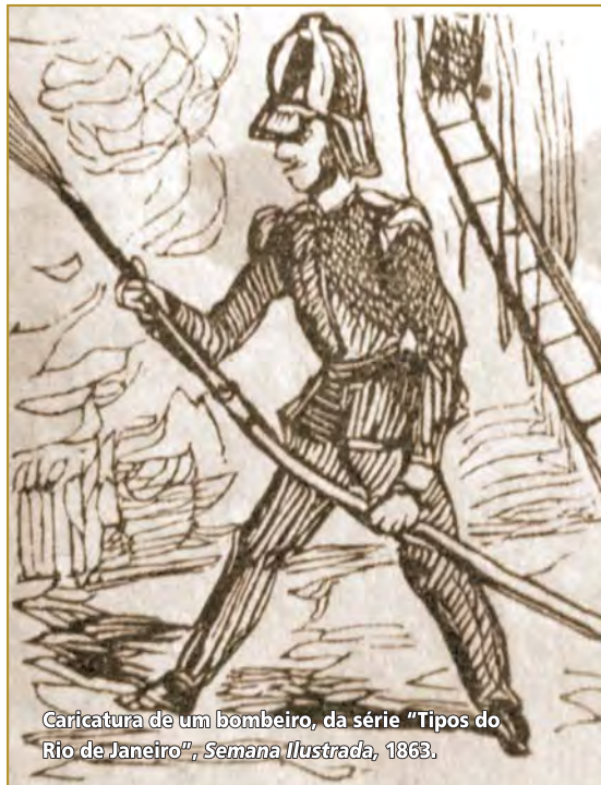
Caricatura de um bombeiro, da série “Tipos do Rio de Janeiro”, Semana Ilustrada , 1863.

(ao lado da Academia Militar no Largo do São Francisco), para o qual todo o pessoal disponível do arsenal se dirigiu, visando salvar o que era possível do teatro e impedir a expansão do fogo para a Academia. Caxias repreendeu o diretor por esse ter abandonado seu posto no Arsenal, para acompanhar os trabalhos da sua tro-