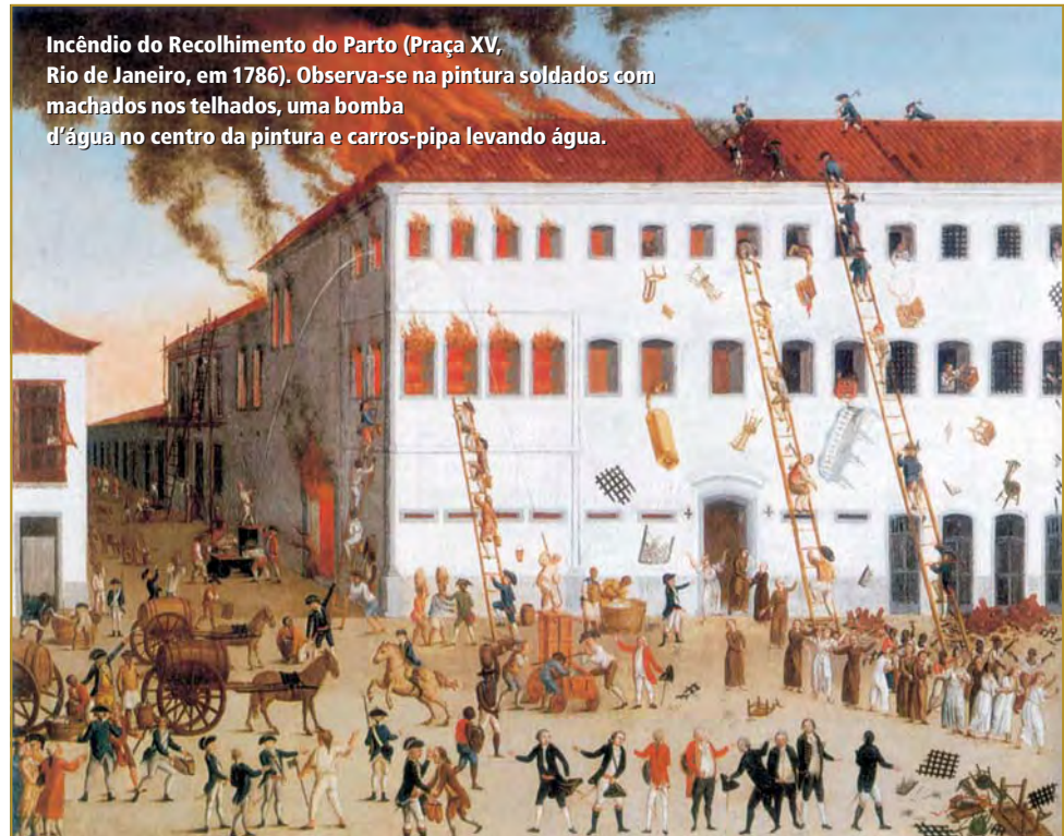
Incêndio do Recolhimento do Parto (Praça XV, Rio de Janeiro, em 1786). Observa-se na pintura soldados com machados nos telhados, uma bomba d'água no centro da pintura e carros-pipa levando água.

tornava aquela organização militar muito apta a combater incêndios, nem que fosse pelo fato do pessoal de lá estar sempre pronto para o combate a incêndios, um grande risco para a instalação devido a sua natureza. Em 1851, quase houve um desastre lá, quando o trapiche usado para embarque de munições pegou fogo, por exemplo. E essa capacidade logo foi reconhecida, tanto é que os equipamentos do arsenal eram uma