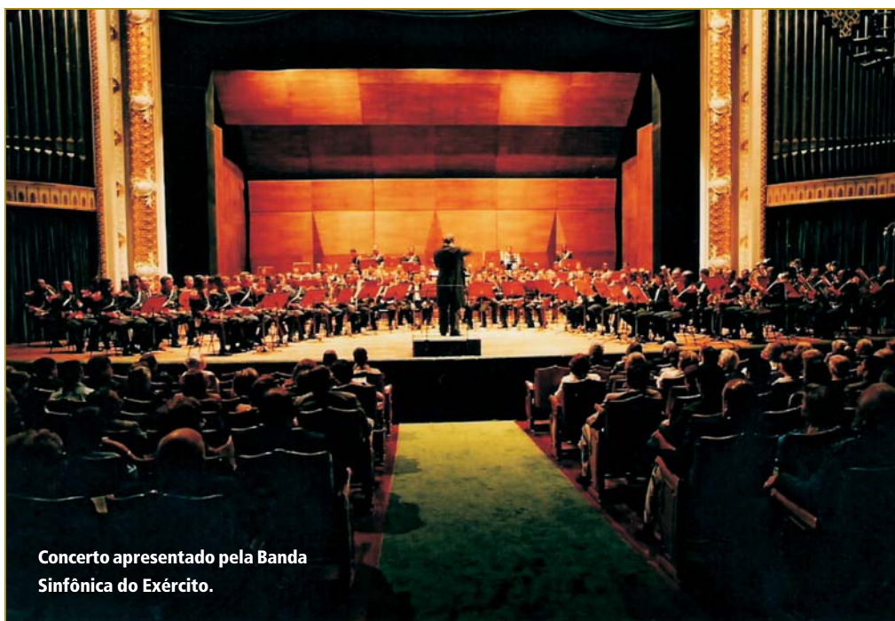
Concerto apresentado pela Banda Sinfônica do Exército.