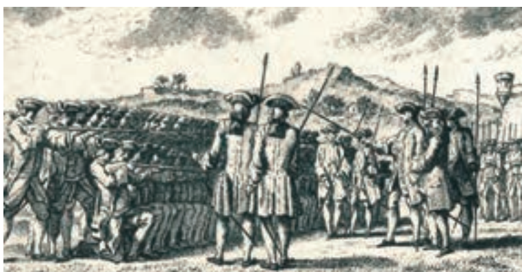
Treinamento militar. Século XVIII.

Acima, tropas coloniais, cada capitania diferente das outras.