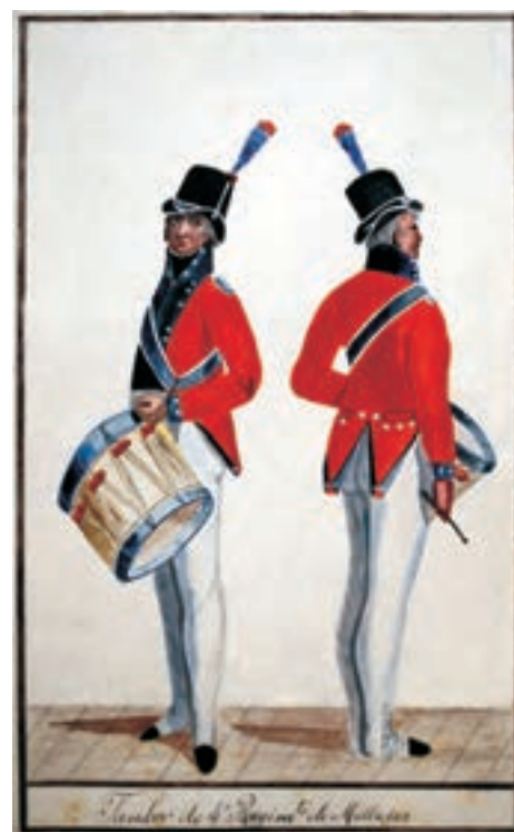
Tambor de milícias de pardos, Salvador, c. 1810.

Essa proposta de redução do Exército, defendida pelos políticos como sendo para a “economia”, teve outras implicações, como a extinção de diversos cargos e estabelecimentos militares, tais como os comandos de armas das províncias, o desastroso fechamento dos hospitais militares espalhados