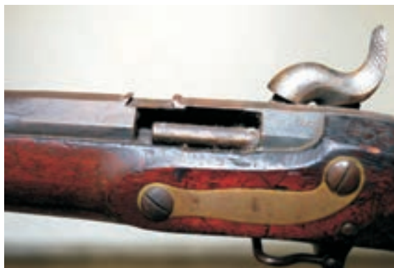
Corte em fuzil Thouvenin, Museu da AMAN.

A partir de 1856, o Exército começou a adquirir armas Minié de um modelo especificamente desenhado para o Brasil, sendo que no ano seguinte o ministro da guerra determinou que esse modelo seria, a partir de então, o regulamentar para toda a infantaria, começando um