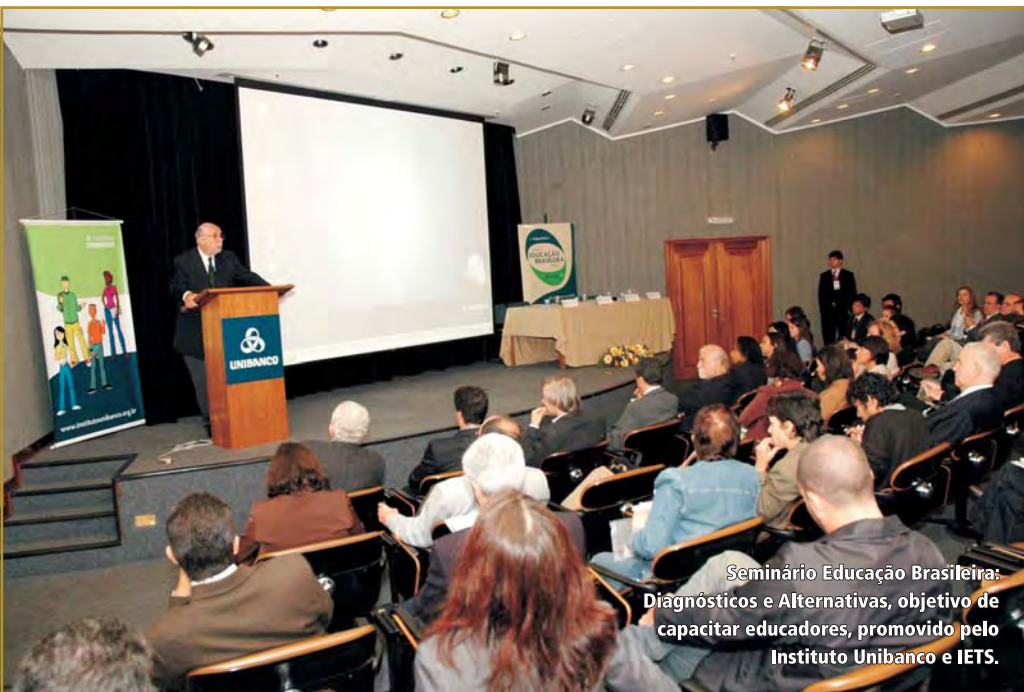
Seminário Educação Brasileira: Diagnósticos e Alternativas, objetivo de capacitar educadores, promovido pelo Instituto Unibanco e IETS.

garantindo a autonomia necessária ao planejamento e execução dessas ações e emprestando sua marca a iniciativas que concentram seus ideais e dão visibilidade à missão social empreendida pela entidade. É o caso do Centro de Estudos Instituto Unibanco, espaço educacional mantido nas proximidades de um dos prédios do Unibanco, em São Paulo, que promove o desenvolvimento educacional e cultural de crianças e jovens da comunidade do Jardim Educandário.